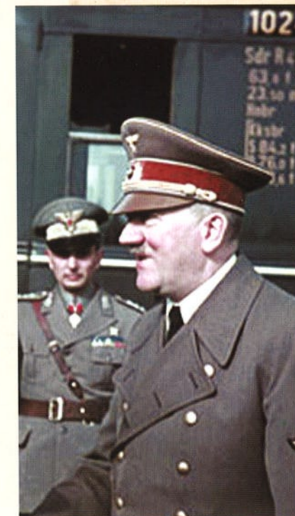
Hitlers weigering troepen terug te trekken hielp de geallieerden.

Europa de baas. De grote invasie over zee van Frankrijk, D-day, legde de basis voor de bevrijding van het bezette Europa. De geallieerden veroverden West-Europa, versloegen het machtige Duitse leger en maakten een einde aan de Tweede Wereldoorlog.