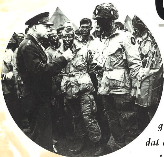
Generaal Eisenhower, bevelhebber van de Amerikaanse troepen.

O p de ochtend van 6 juni 1944 stak een invasievloot het Kanaal over. Vanuit havens aan de zuidkust van Engeland brachten 4000 schepen ruim 200.000 soldaten over een sombere grijze zee. De schepen waren die nacht in het donker vertrokken. Geen van de soldaten of officieren wist waar ze heen gingen. Ze wisten alleen dat deze dag D-day genoemd werd.