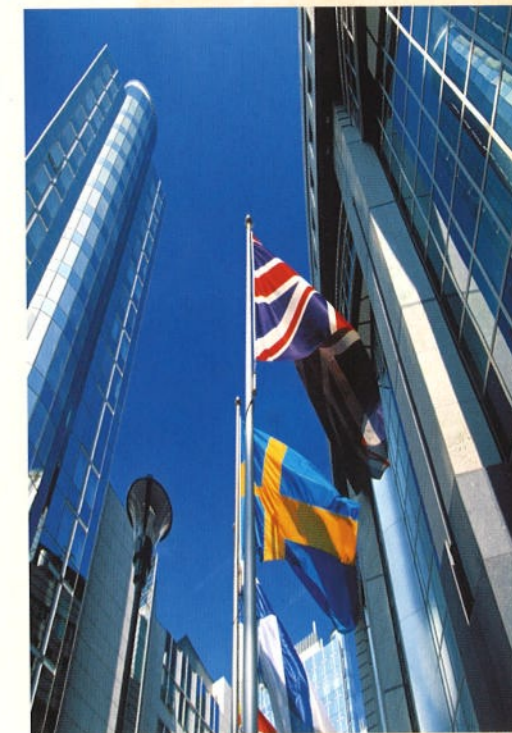
Tegenwoordig is Duitsland een belangrijke factor in Europa en het Europees Parlement (boven) en voorstander van de gemeenschappelijke munt, de euro.

de euro en er zijn zelfs plannen voor een Europees leger. Elk jaar komen mensen uit heel Europa bijeen om diegenen te herdenken die al die jaren geleden hun leven gegeven hebben voor onze vrijheid.