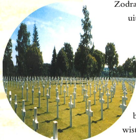
Duizenden soldaten die op D-day sneuvelden, liggen op dit oorlogskerkhof in Normandië begraven.

Zodra het schip de haven uit was, opende de dienstdoende officier een verzegelde envelop met de gedetailleerde instructies en kaarten om het doel te bereiken. Eindelijk wisten ze hun bestemming. Ze zouden landen op de stranden van Normandië, aan de noordkust van Frankrijk. Het was een indrukwekkende vloot. Afgezien van de troepenschepen stonden meer dan duizend oor-