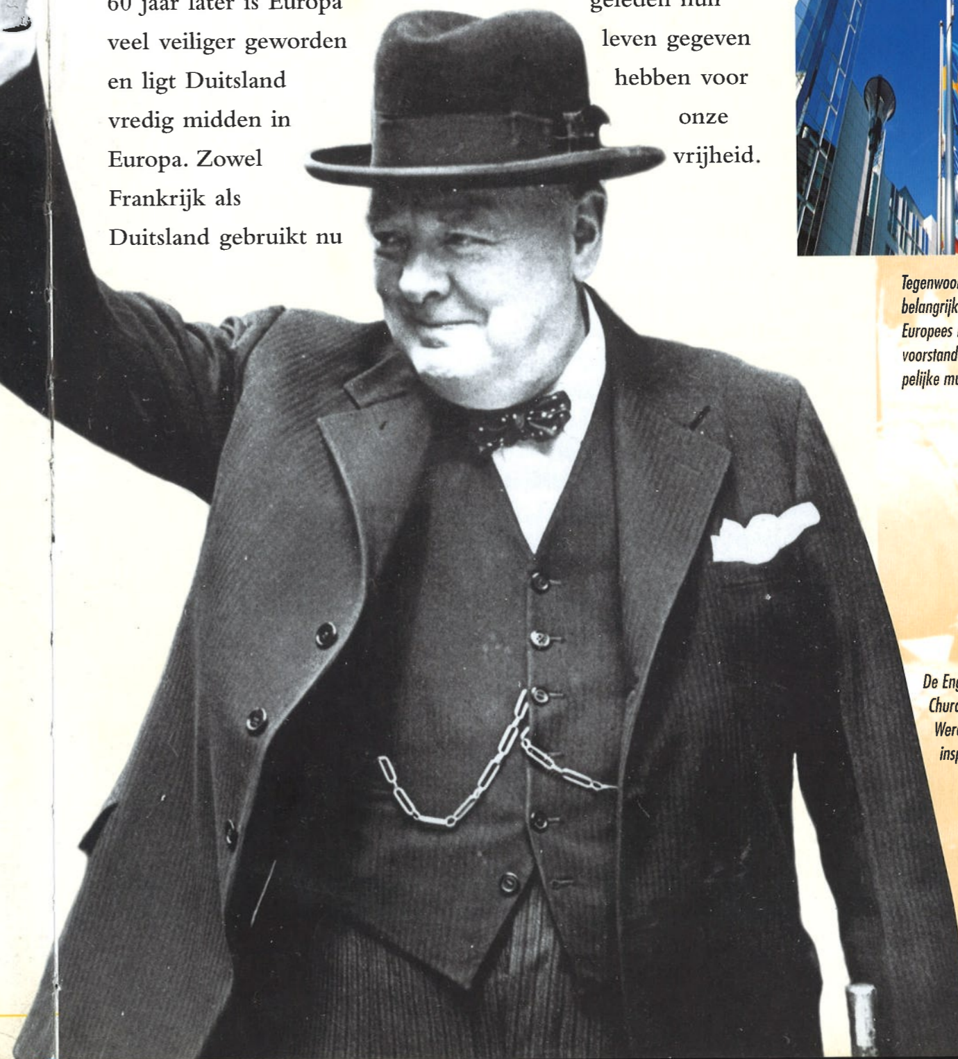
De Engelse premier Winston Churchill was in de Tweede Wereldoorlog een bron van inspiratie.