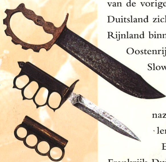
Bij gevechten van man tegen man werden gemene wapens gebruikt.

Europa leefde in angst sinds in Duitsland Hitlers nazi-partij aan de macht kwam, in de jaren 30 van de vorige eeuw. Toen Duitsland zich bewapende en het Rijnland binnenviel en daarna Oostenrijk en Tsjechoslowakije, keek de wereld angstig toe, maar toen de nazi's Polen binnenvielen, verklaarden Engeland en Frankrijk Duitsland de oorlog. Dat was het begin van de Tweede Wereldoorlog.